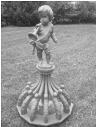
Een foto van één van beide beeldjes.