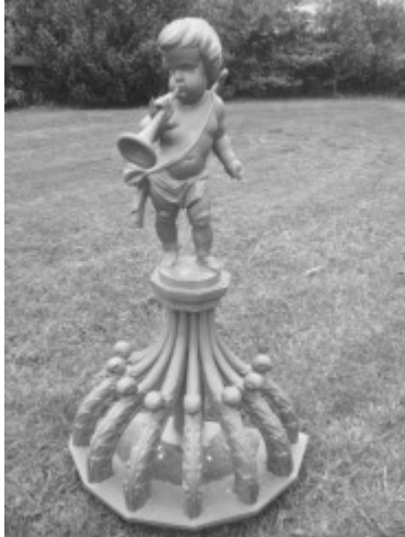
Een foto van één van beide beeldjes.